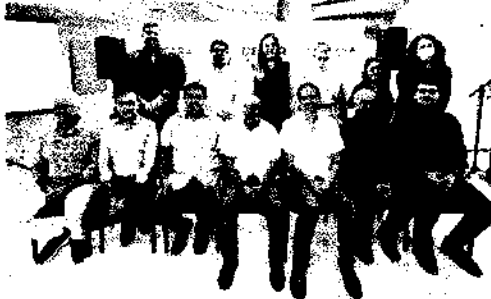
PREFEITAS DE 11 municípios assinaram o termo de adesão ao programa Ceará por Elas

Em cada categoria, há políticas públicas de apoio ao público. Entre as ações previstas no programa estão, em categoria Mulher Segura, a inclusão de equipamentos para atendimento às mulheres em situação de violência, patrulhas Maria da Penha nas guardas municipais e formação especializada para rede de atendimento. No eixo Mulher Empreendedora, a pasta prevê a criação ou fortalecimento de Organismos de Políticas para Mulheres (OPM) e Conselhos Municipais (CEM), ampliação da participação feminina nos cargos de liderança e a criação ou implementação do Plano Municipal de Políticas para as Mulheres.