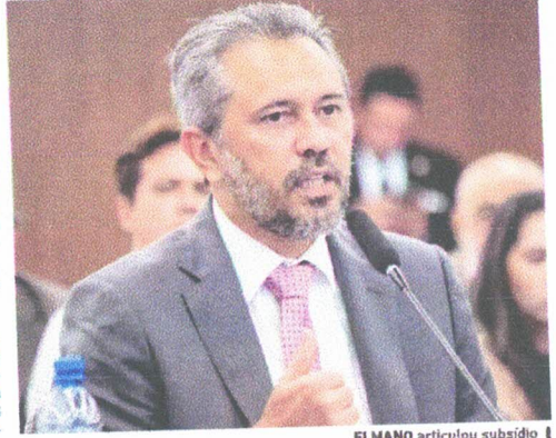
ELMANO articula subsídio com a construção civil

O governador Elmano de Freitas (PT) enviou na noite de segunda-feira, 15, à Assembleia Legislativa mensagem que cria o programa Entrada Moradia Ceará, que irá ampliar em até R$ 30 mil o subsídio concedido a imóveis adquiridos pelo programa Minha Casa Minha Vida (MCMV) no Estado.