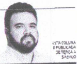
ESTA COLUNA PUBLICADA DE TERÇA A SÁBADO