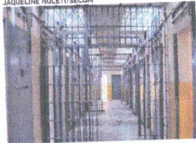
SAIDINHA de detentos das penitenciárias virou alvo dos legisladores