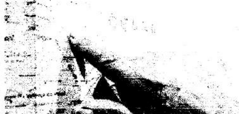
ÁREA de litígio entre Ceará e Piauí: estados juntam documentação