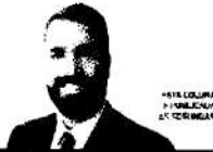
4118 COLUNA PUBLICADA EM 02/06/2024